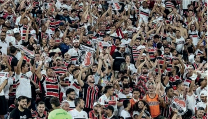
Santa Cruz já vendeu mais de 30 mil ingressos para duelo com MAC, na Arena Pernambuco

O Maranhão enfrenta o Santa Cruz neste sábado (20), às 19h30, na Arena de Pernambuco, em busca da classificação à final da Série D do Brasileiro e se isso acontecer, o MAC não terá a oportunidade de decidir a final em casa, no Castelão, diante da sua torcida, se avançar para a decisão. O critério que define o mando de campo na segunda partida da decisão é a pontuação acumulada ao longo do campeonato no ranking geral e o Maranhão tem apenas 32 pontos somados até agora, enquanto que Santa Cruz soma 39 pontos, Inter de Limeira-SP soma 42 pontos e Barra-SC, soma 43 pontos. Portanto, o MAC só pode chegar a 35 pontos e assim, não tem como ultrapassar nenhum dos dois possíveis adversários da outra semifinal (Barra-SC ou Inter de Limeira-SP) caso vá para a grande decisão da Série D. Dessa